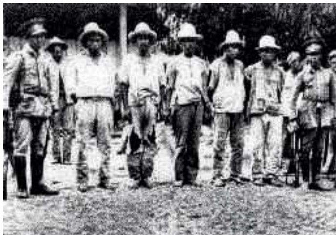
Trabajadores capturados después del levantamiento de 1932

Se puede concluir diciendo que a la luz de los expedientes actualmente disponibles, San Salvador dista de la visión idealizada de que en tiempos pasados la ciudad manejaba un contexto de criminalidad muy limitado, aunque valga la mención de que si se realiza la comparación entre la década de los veinte y lo que se lleva del siglo XXI esta afirmación cobra tintes de validez, aunque esta afirmación se vuelve discutible debido a que la criminalidad de entonces se desarrollaba de modos totalmente distintos a los que se desarrolla en la actualidad, donde buena parte de los hechos criminales son ejecutados por estructuras de crimen organizado.