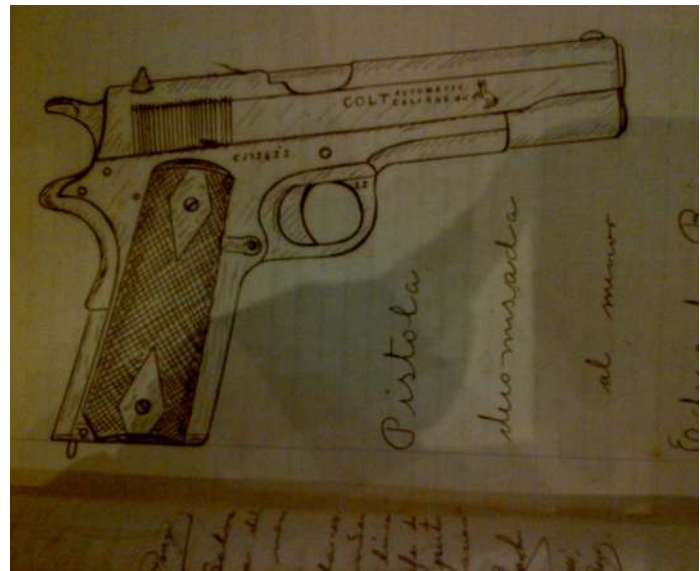
Escuadra colt de 45mm decomisada a un menor de edad que ostentaba el puesto de “corneta” de la guardia presidencial en el año de 1925

Combinando todos los tipos de armas de fuego que nos muestran los expedientes, su utilización en los crímenes se reduce a 9 hechos. El uso de las armas de fuego para cometer crímenes estaba poco generalizado, su uso lo ejercían por lo general personas que poseían la suficiente capacidad económica para adquirirlas, o también, se trata de personas vinculadas al Ejército, la Guardia Nacional, la Policía y otros cuerpos armados pertenecientes al Estado o al gobierno municipal.