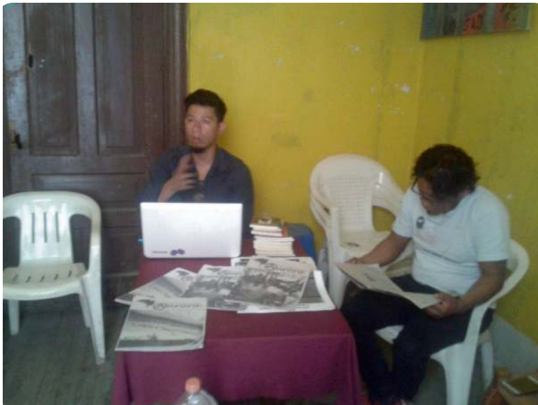
Compañero presentando la revista Aurora en México