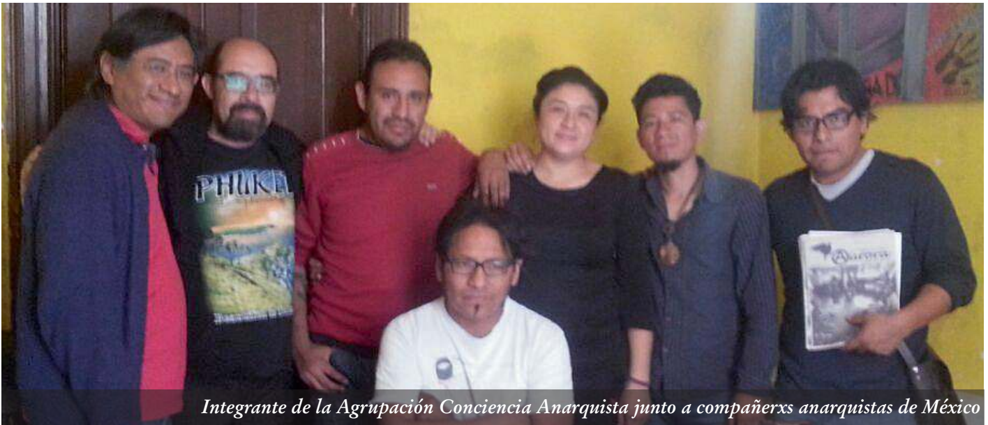
Integrante de la Agrupación Conciencia Anarquista junto a compañerxs anarquistas de México