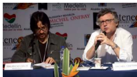
Conferencia de Onfray en Medellín

Los seres humanos somos animales éticos y políticos y el filósofo Michel Onfray nos invita a erigirnos hacia ese ideal estético.